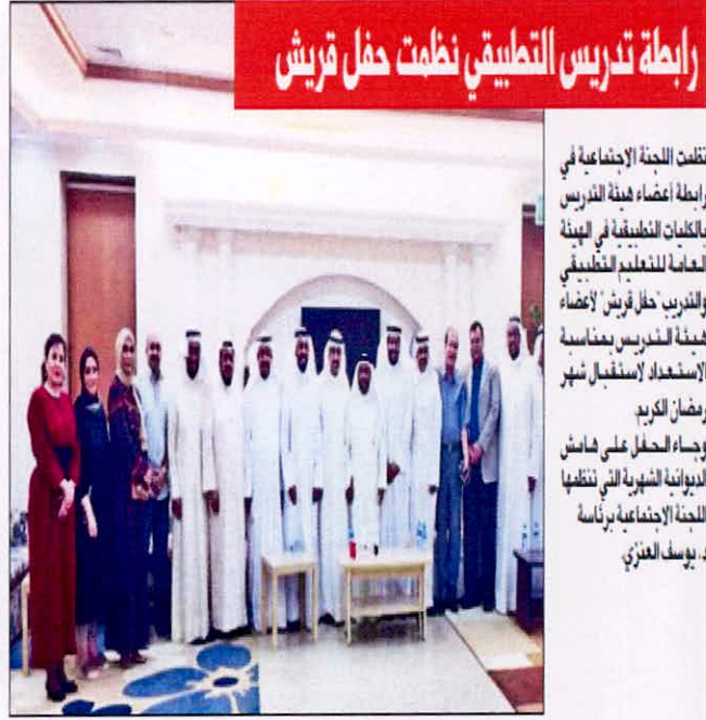
صورة جماعية للمشاركين في القریش